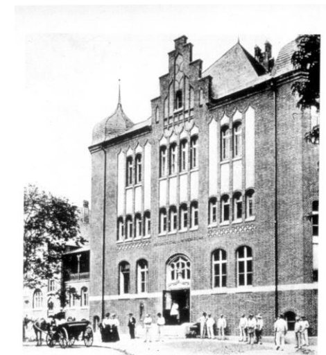
Gruss aus Berlin